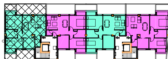
LOCALIZACION EN EL EDIFICIO